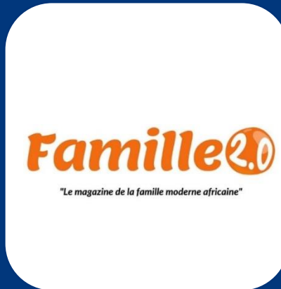
Magazine Famille 2.0