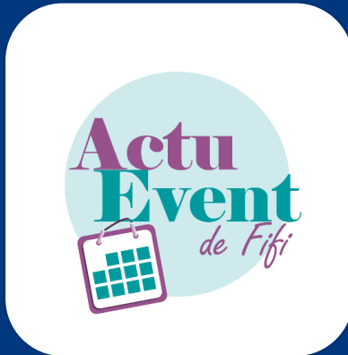
Actu Event de FiFI